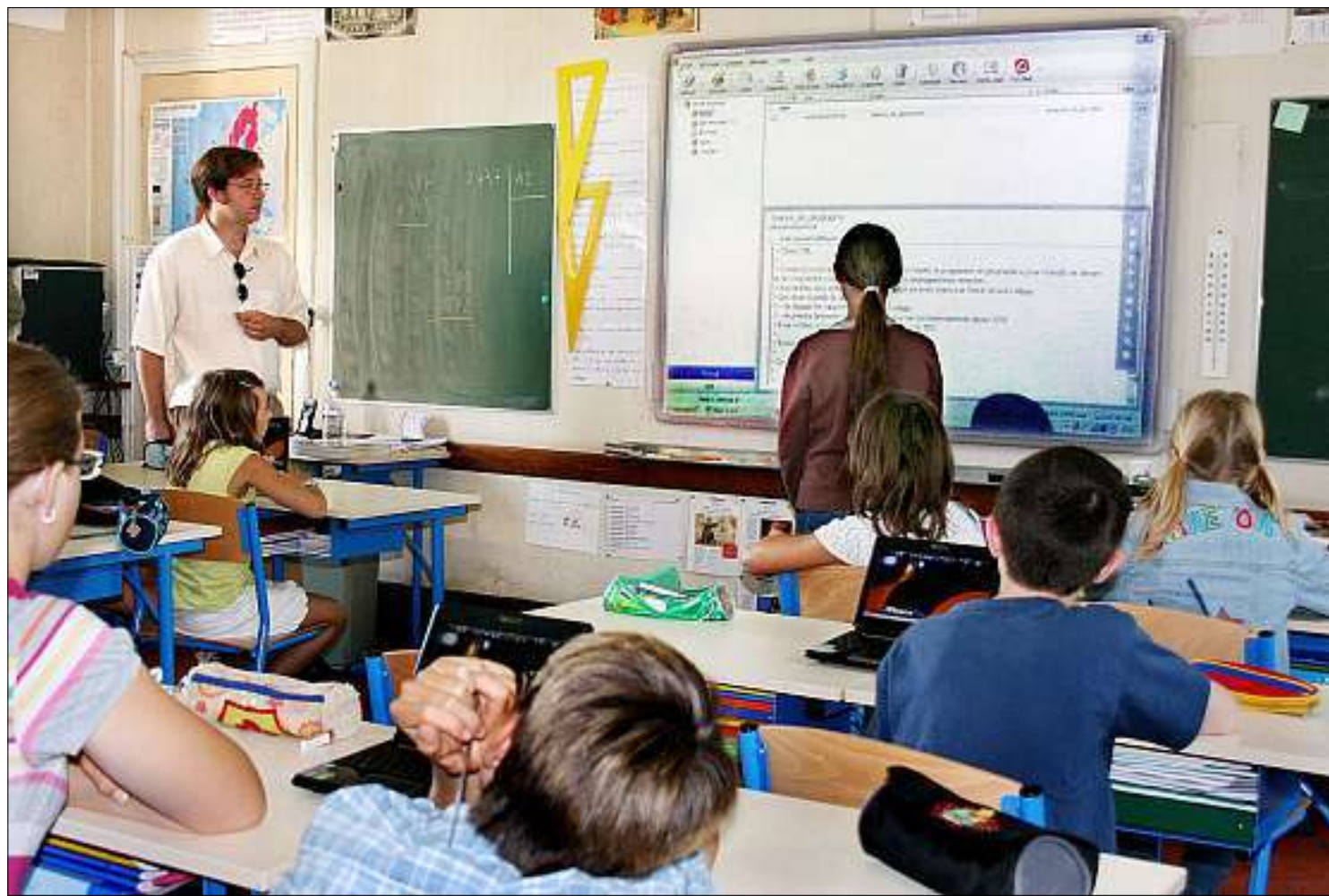
Tous les regards se tournent désormais vers l'écran tactile, qui a repoussé les « vieux » tableaux sur les côtés.

■ LOIRET. L'école de la petite commune du Montargois est l'une des vingt premières en zone rurale, en France, à passer à l'ère informatique, avec ordinateurs portables et tableau blanc interactif.